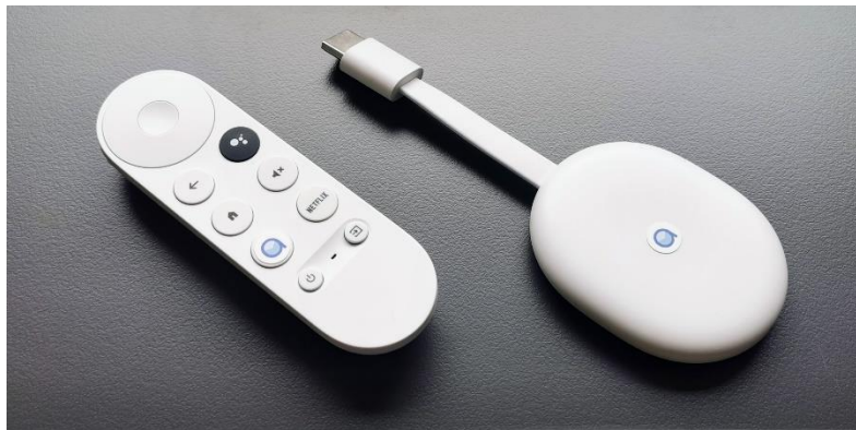
Bild 1 AdanaTV-Stick

Sie können bei uns direkt den AdanaTV-Stick (Android Stick mit HDMI) bestellen. Dieser wird per WLAN (optional: LAN) mit dem Internet verbunden. Auf diesem läuft über die „AdanaTV Patientenaufruf“-App der Patientenaufruf und die Wartezimmer-TV Präsentation.